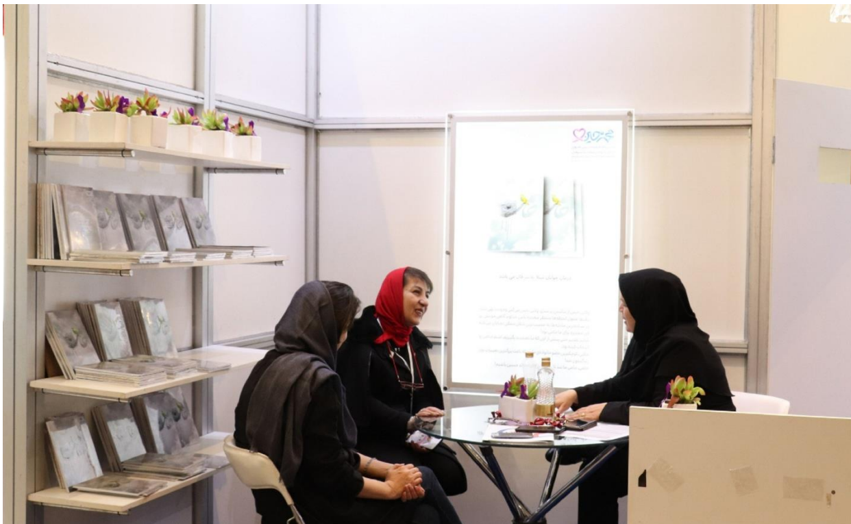
حضور نماینده خیریه ریحانه سعادت در غرفه موسسه و آشنا شدن با فعالیتهای موسسه توسط مددکاران موسسه