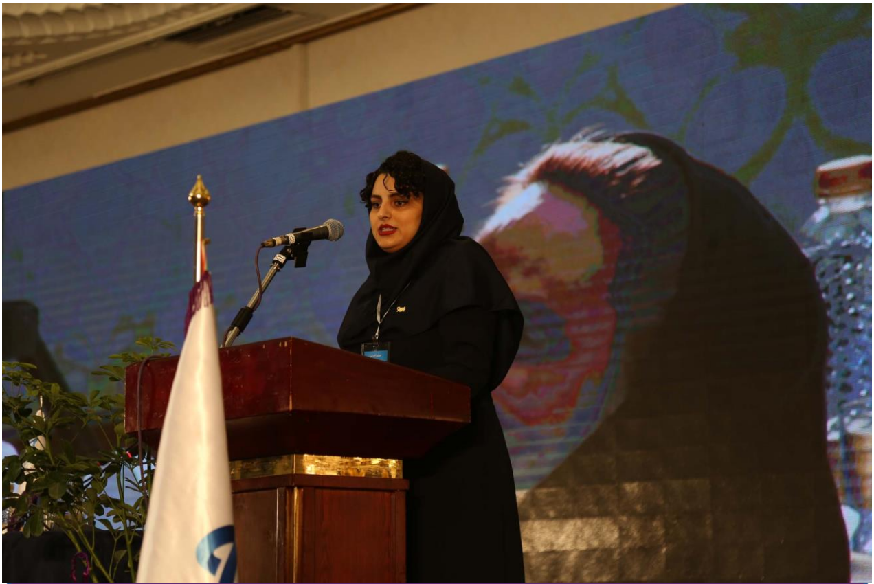
سخنرانی جوانان بهبود یافته موسسه خیریه محمد حسین رضوی در مراسم افتتاحیه نخستین سمینار سرطان در جوانان