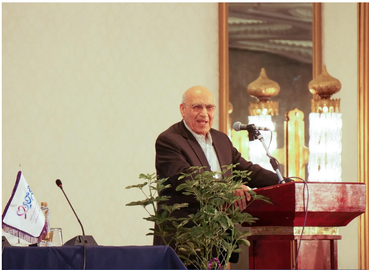
سخنرانی جناب آقای پروفسور اردشیر قوام زاده (رئیس انجمن هماتولوژی - آنکولوژی و پیوند ایران) در مراسم افتتاحیه نخستین سمینار سرطان در جوانان