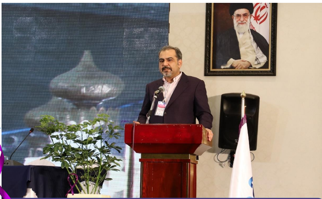
سخنرانی جناب آقای دکتر امیر ناظمی (معاون وزیر و رئیس سازمان فناوری اطلاعات) در مراسم افتتاحیه نخستین سمینار سرطان در جوانان