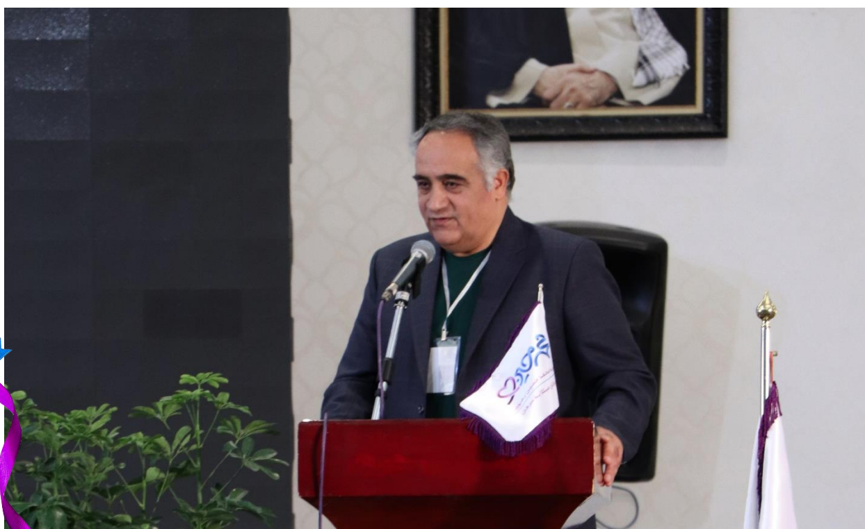
سخنرانی جناب آقای دکتر ناصر پارسا (متخصص ژنتیک پزشکی) با موضوع ژنتیک در سرطان جوانان در نخستین سمینار سرطان در جوانان