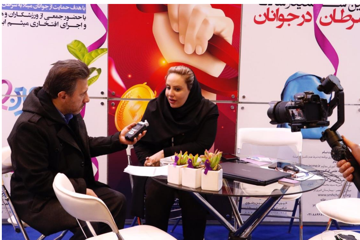
حضور خبرگزاری های مختلف در غرفه موسسه و تهیه گزارش خبری از نخستین سمینار سرطان در جوانان