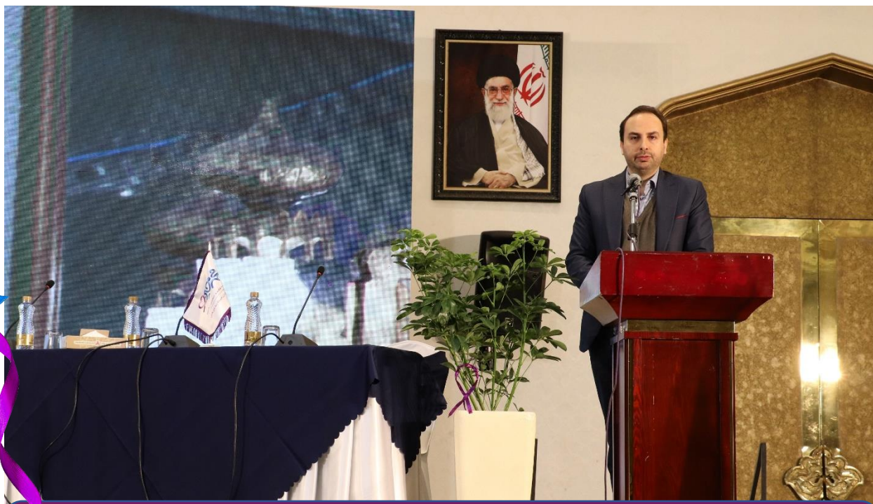
سخنرانی جناب آقای دکتر علی قنبری مطلق (رئیس اداره مبارزه با سرطان وزارت بهداشت) با موضوع افق های مدیریت درمان در سرطان جوانان، در مراسم افتتاحیه نخستین سمینار سرطان در جوانان